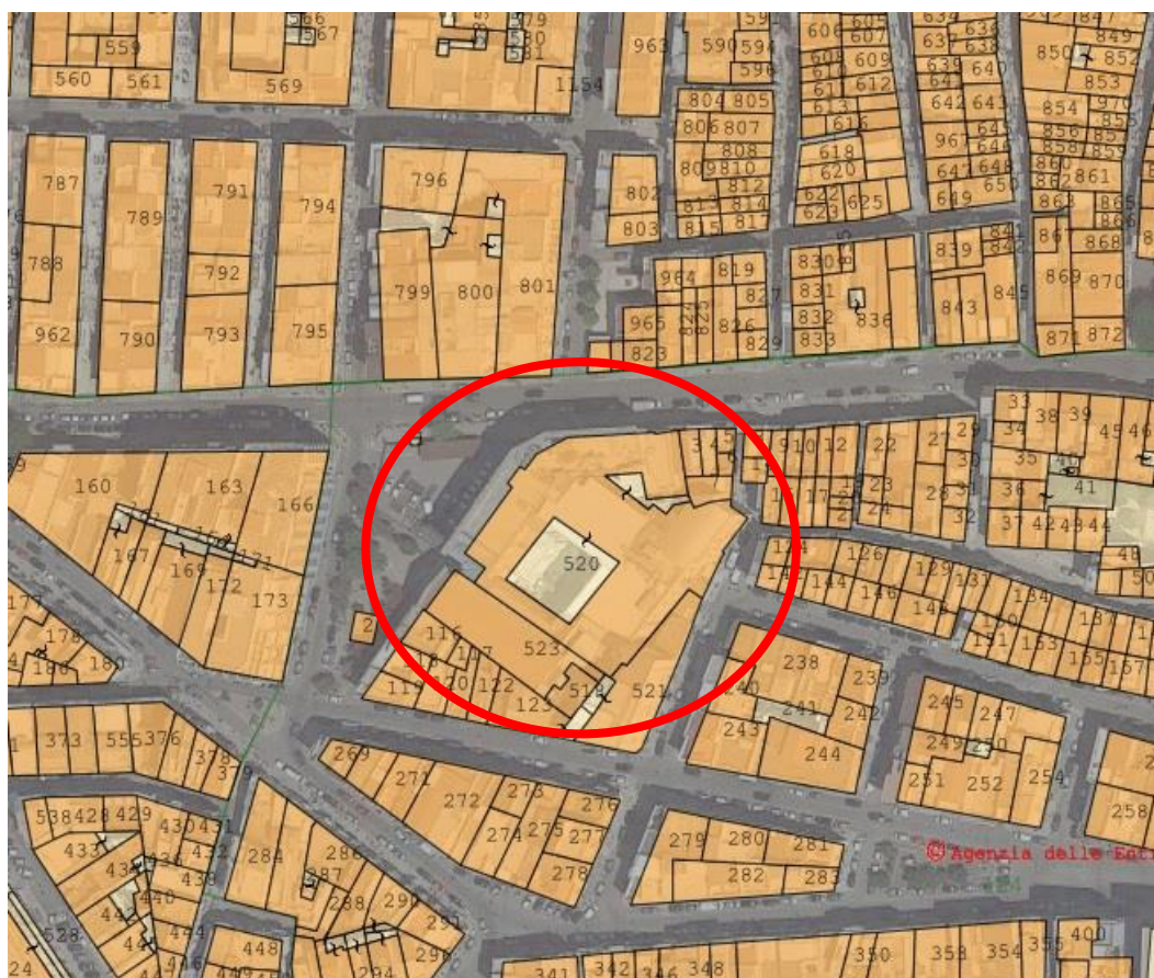
Figura 1: Estratto di scheda catastale

L'area è identificata al Catasto Fabbricati – Ufficio Provinciale di Bari al foglio n. 134, particella 520, ubicato in Piazza Principe Umberto I.