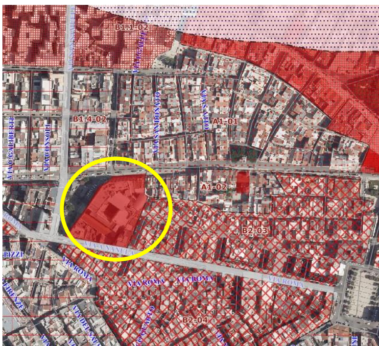
Figura 3: Estratto del PRG del Comune di Barletta

Per quanto riguarda la pianificazione urbanistica, l'area oggetto d'intervento è inclusa all'interno della zona ZONA "B" - - EDIFICI SOTTOPOSTI A TUTELA del PRG. Di seguito lo stralcio del PRG del Comune di Barletta.